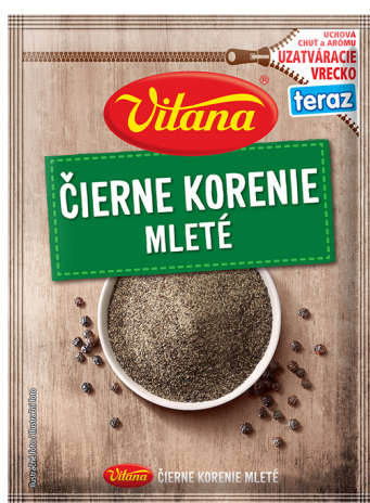
Čierne mleté korenie

Vypražené kúsky tresky podávame so zemiakmi a majonézou vymiešanou s citrónovou šťavou a čiernym korením Vitana.